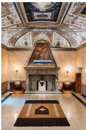
1. Opere di Aldo Mondino nella Sala delle udienze papali

Mekka Mokka 1988 100 kg di caffè in grani e disegno su carta da spolvero 220 x 140 cm Archivio Aldo Mondino