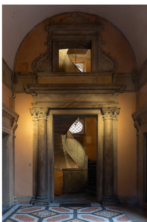
3. Palazzo Boncompagni seconda metà del XVI secolo, ingresso della scala attribuita a Jacopo Barozzi, il Vignola